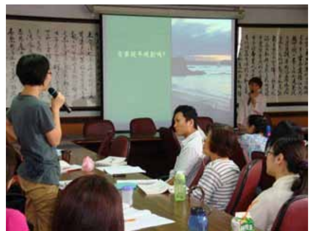
與會老師即時提問。