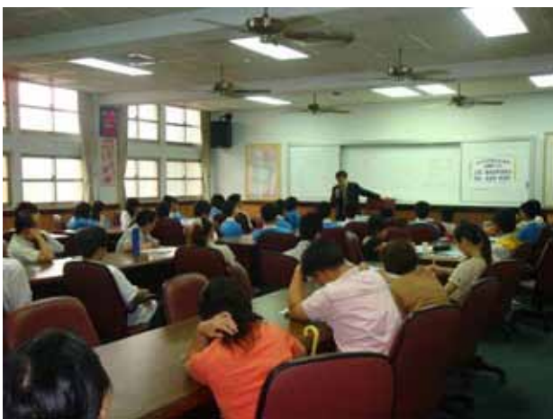
與會人員專注聽講。