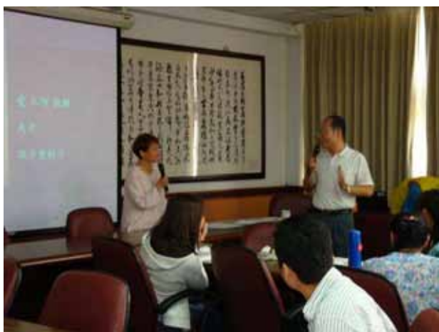
與會老師把握機會提問。