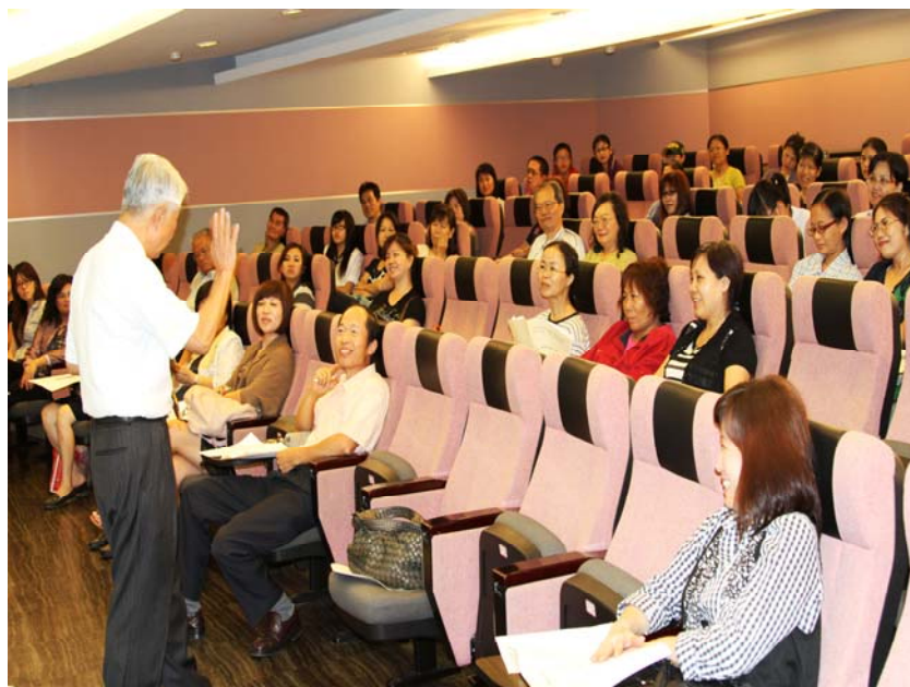
孩子是需要被讚賞、肯定、尊重；需要被愛與關懷的。